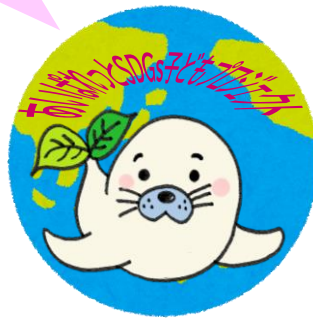
オリジナル缶バッジ