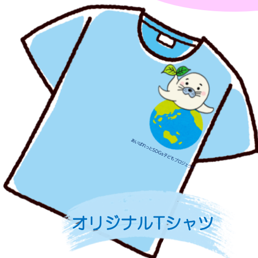
オリジナルTシャツ